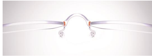
ブリッジの3軸ロー付け 上面図イメージ (UM001~004)

テンプルの機能を最大限に発揮する上でフロントの柔軟な強度がとても重要です。フロントの強度が確保できないとテンプルの機能が発揮できなくなります。UM-001~004のブリッジは、リムに対して、正面・側面・後面の3つの面でロー付けする3軸ロー付けを行っており、より高いフロント強度を確保しています。3軸のロー付けは、製造時に熱の影響を受けやすいため、工場の高い技術力があるからこそ実現できます。3つの面でロー付けすることにより、高いフレームバランスが作られ、快適な使用環境が生まれます。